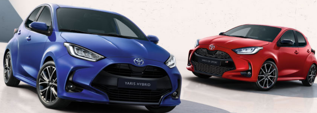
Yaris monotone kleuren