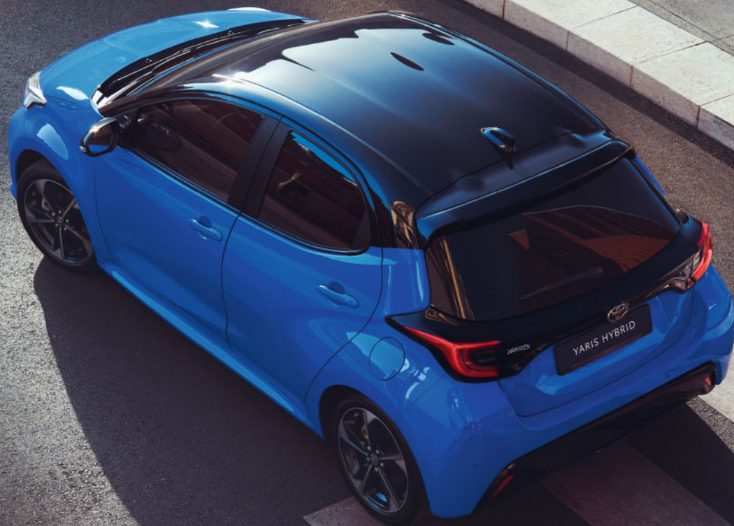
Yaris bi-tone kleuren

Kies uit een sprankelend palet van effen kleuren en flonkerende metallic kleurstellingen. Waaronder de twee compleet nieuwe kleuren Juniper Blue en bi-tone Neptune Blue, waarmee jouw nieuwe Yaris zeker de aandacht trekt.