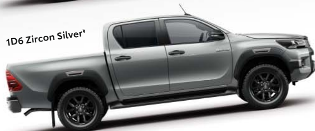
1D6 Zircon Silver §