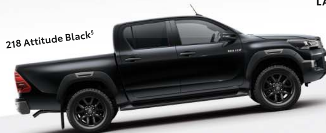
218 Attitude Black §