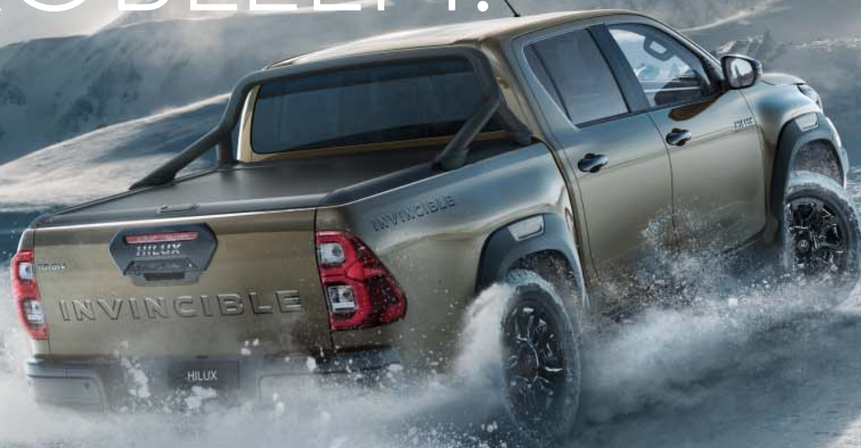
Afgebeeld: Hilux Invincible