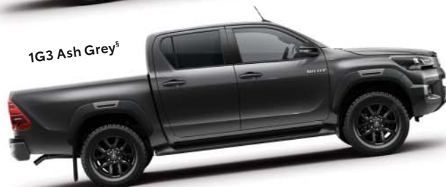
1G3 Ash Grey §