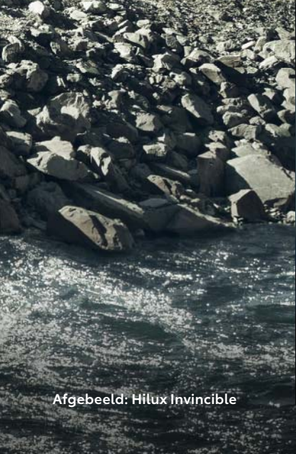
Afgebeeld: Hilux Invincible

Met een onverwoestbaar chassis, een bodemvrijheid van 700 mm en uitzonderlijke veerweg vormt zelfs het zwaarste terrein geen obstakel. De onderdelen hebben een uniek design dat met intensieve rijtests gedurende meer dan vijftig jaar werd fijngeslepen. Het resultaat: een uniek voertuig. Ontworpen en gebouwd als geen enkele andere pick-up.