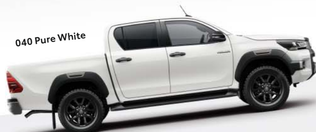
040 Pure White