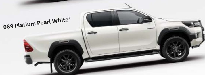
089 Platium Pearl White*