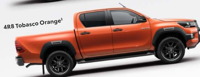
4R8 Tobasco Orange §