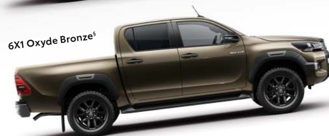
6X1 Oxyde Bronze §