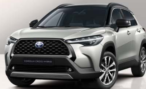
Corolla Cross bi-tone kleuren