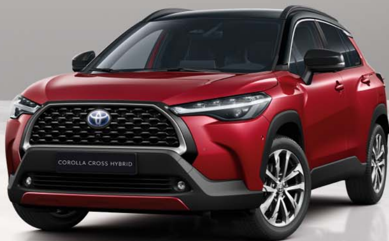
Corolla Cross mono-tone kleuren