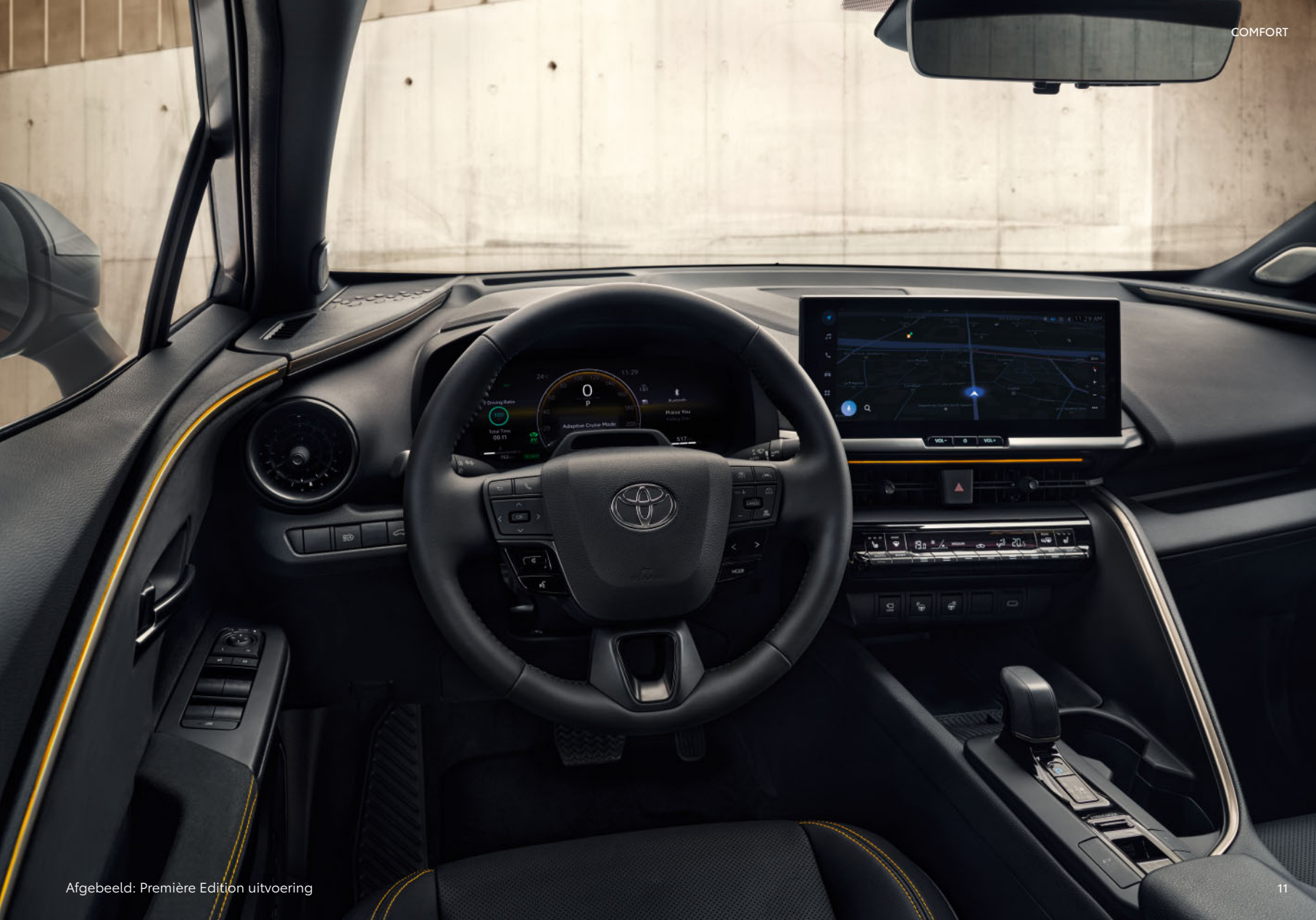
Afgebeeld: Première Edition uitvoering